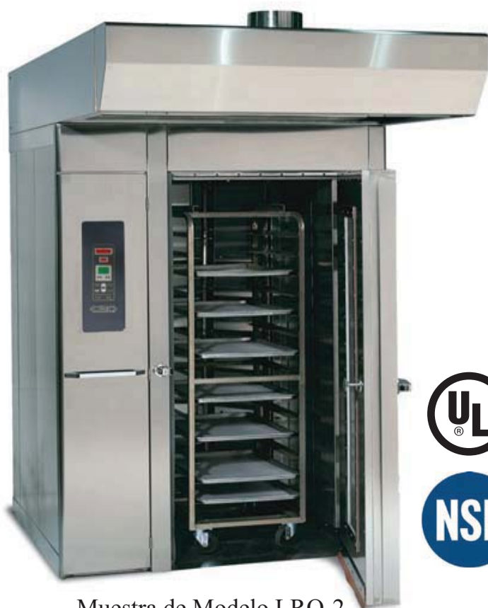
Muestra de Modelo LRO-2 (Raca no incluida)