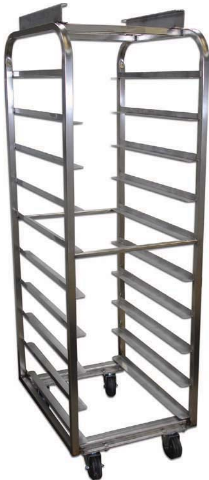
Raca individual de acero inoxidable