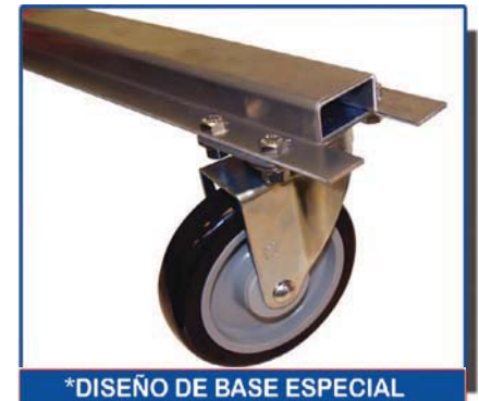
*DISEÑO DE BASE ESPECIAL