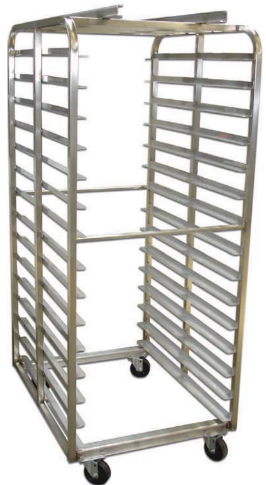
Raca doble de acero inoxidable

¡Especialmente hecho para sus necesidades!