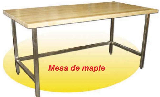
Mesa de maple