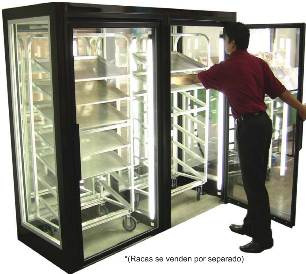
*(Racas se venden por separado)