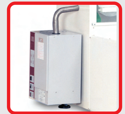
Particolare del generatore di vapore (opzionale). Particular of the steam generator (optional).